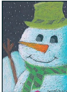
Carte No 1003V